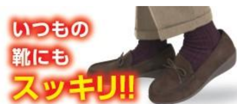
寒い日の外出時にお勧めの 「はくらく 2重編み靴下」

高齢者の方、特に女性は足首、手首、ひじ、かかと、ひざなど、関節を中心に温めることを意識してください。外に出る時は、温かい手袋、靴下等を着用すると共に、脱ぎ着できるショールやカーデガン等を持参して体温調節を心がけ、新しい生活様式においても、体を冷やさず、免疫力を低下させないように注意しましょう。